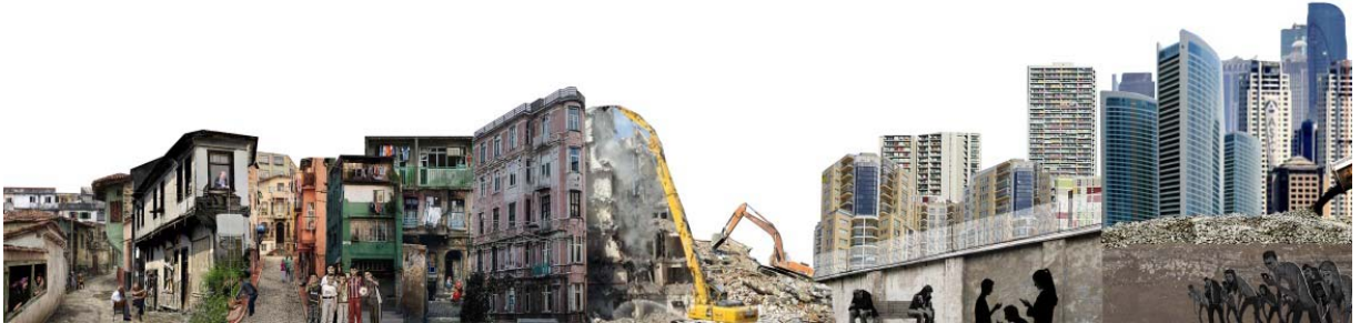
Kolaj 3. Komşuluk (Cansu Soysal)

"Mekan üretimi sadece yeterli miktarda otopark ve açık alanla olmak demek olmamalı, insanların birbirleriyle karşılaşmasını sağlayan ortak mekanları da içinde barındırmalıdır... Kentsel dönüşüm; mahalle kültürü, komşuluklar, samimiyet, güven hissi, dayanışma gibi eskiedair ne varsa yok ediyor. Mimarlığın kent ve insanla bir bütün olduğu unutulduğu için var olanın yerine yapılmaya çalışılan kamusal mekanlar ile kentin en yaygın karşılaşma mekanı olan sokaklar bile kentleşmenin getirdiği dayanılmaz yüke(kentsel dönüşüm yıkımına) yenik düşüyor ve ötekileştirilmelkide ilk olarak komşumuz ile aramızdaki bu ulaşım ortamında başlıyor. Apartmanlaşma sürecinde fazlasıyla zarar görmüş mahalle kültürü şimdi hepten yok oluyor. Şehir planlamasını göz önünde bulunduran, mimari, yerel malzeme ve kültürü dikkate alan, hakları savunan, kente zarar vermeyen bir dönüşüm örneği günümüzde yok denecek kadar azdır." Aleyna Yaşar