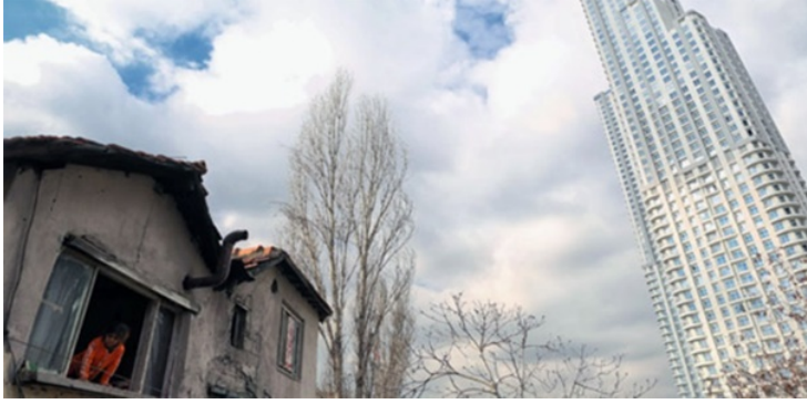
Foto 2. Kentsel Dönüşüm

( http://1001documentary.net/filmayrinti.php?film=Kor