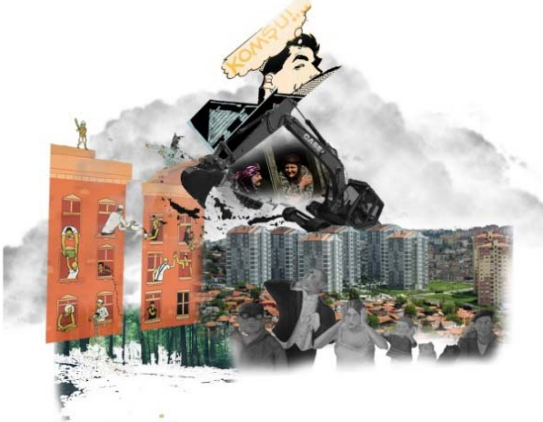
Kolaj 2. Komşuluk (Büşra Sözbilen)

(*a-kültürel 'eskiden var olan kültürel yapısı bozulmuş, kültürü kalmamış kent' anlamında kullanılmıştır.)