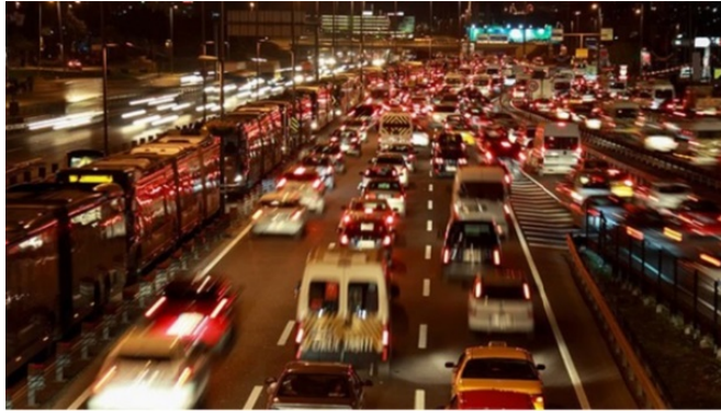
Foto 4. İstanbul'da trafik yoğunluğu ( https://m.sondakika.com/haber/haber-istanbul-tr-9055308/ )