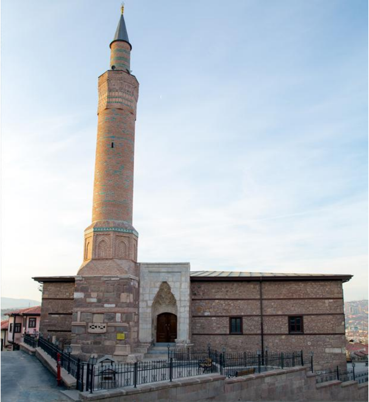
Şekil 4. Aslanhane Camii minaresi ve taş kapılı giriş [12]