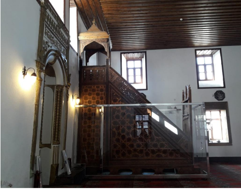
Şekil 12. Sultan Alaaddin Camii taklit kündekari ahşap minberi [19]

madalyonlar görülmektedir. Genellikle çıtalarla oluşturulmuş, ortası ahşap göbekli olan ahşap tavanlar da Ankara cami ve mescitlerinin genel bir özelliğini göstermektedir.