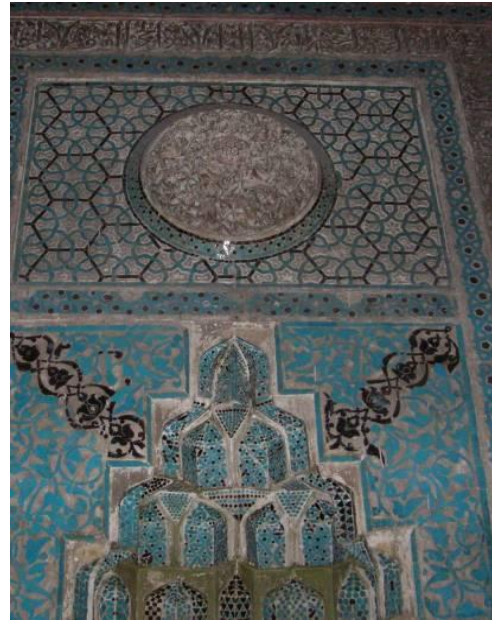
Őekil 11. Aslanhane Camii alı mihrabı [19]

Aslanhane Camii ve Cenabı Ahmet PaŐa Camilerinin giriŐ cephelerinde mukarnaslı ta kapı bulunmaktadır. Sultan Alaaddin Camii, Aslanhane Camii, Sara Sinan Camii, Gecik Kadın Mescidi ve KurŐunlu Camisi'nde devŐirme taŐ kullanılmıŐtır. Halla Mahmut Mescidi (Őekil 9), Cenabı Ahmet PaŐa Camii (Őekil 10) ve Hacı Bayram Camilerinde kalem iŐi sslemeler yer almaktadır. Bunun dıŐında Sultan Alaaddin Camii, Eyp Mescidi (Őekil 13), rtmeli Mescidi, Sabuni Mescidi, YeŐil Ahi Camii ve Abdlkadir İŐfahani Mescidi'nde aşşaplar zerinde aŐı boyalı kalem iŐleri yer almaktadır. AŐşap yzeylerdeki kalem iŐi sslemelerin tavan kenarlarında, konsollarda ve pervazlarda ve tavan kiriŐlerinde yođunlaŐtıđı grlmektedir. Bu sslemelerde zellikle bitkisel motiflerin kullanımı tercih edilmiŐtir. Bu sslemelerde, basit gller ve yapraklar, nar ieđi, papatya, karanfil ve