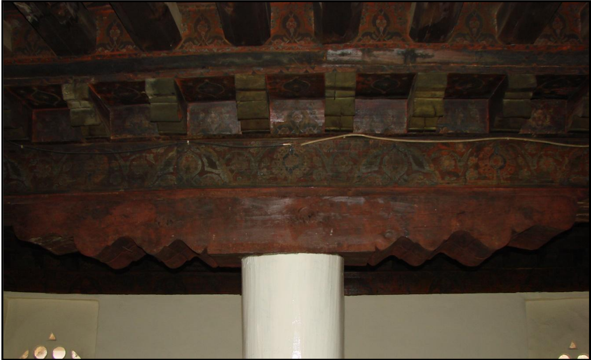
Şekil 13. Eyüp Mescidi ahşap yüzeylerde aşı boyalı kalemişleri[19]