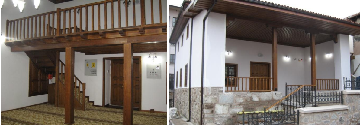
Şekil 3. Balaban Mescidi kadınlar mahfeli ve yanları kapalı önü açık son cemaat [19]

İnceleme yapılan camilerin 4 tanesinde çıkmalı, 16 tanesinde çıkmasız olarak toplam 20 tanesinde mahfel katı vardır. 6 adet camide ise mahfel kat bulunmamaktadır. Ancak; bu camilerde bulunan mahfel katlarının tamamının özgün olduğunu söylemek doğru değildir. Genel olarak mahfel katları sonraki dönemlerde ortaya çıkan ihtiyaç doğrultusunda yapılmıştır.