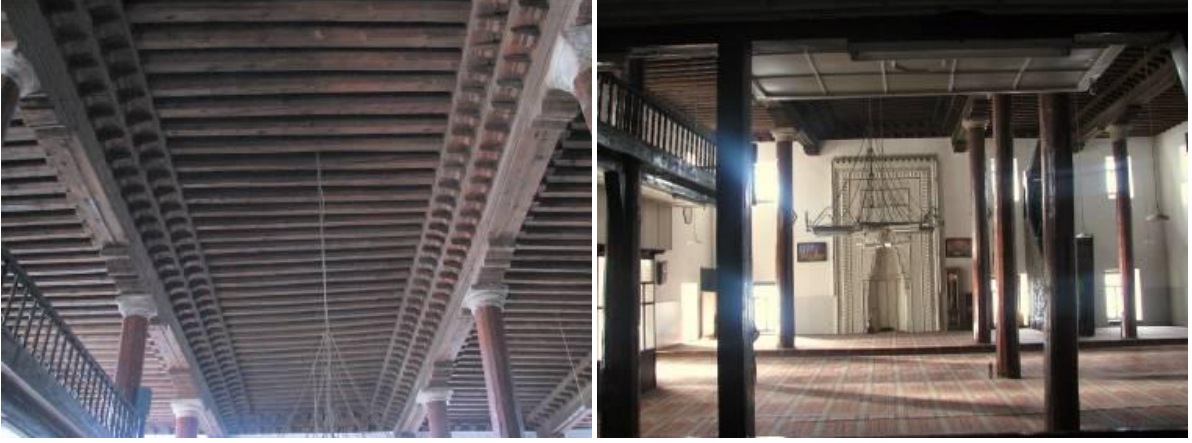
Şekil 7. Ahi Elvan Camii tavan ve ahşap taşıyıcılar [12]