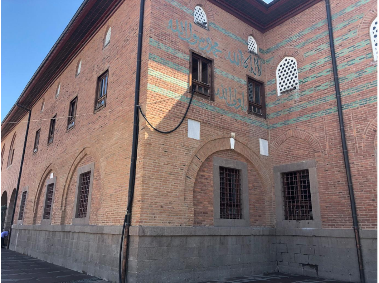
Şekil 6. Hacı Bayram Veli Camii kemer alınlıklı pencere ve dışlık uygulaması [12]