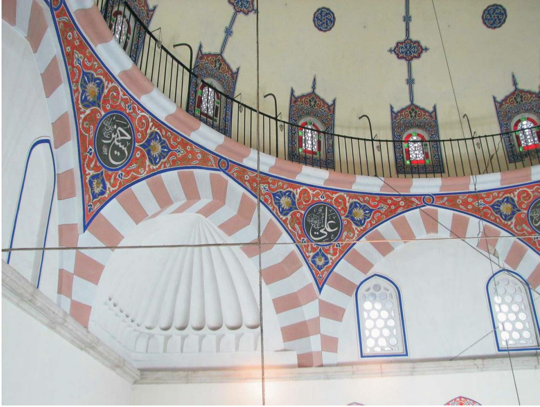
Şekil 10. Cenab-ı Ahmet Paşa Camii tromp [12]