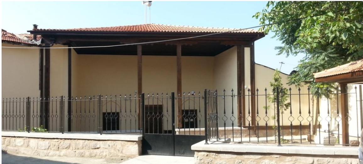
Şekil 2. Eyüp Mescidi açık son cemaat [12]