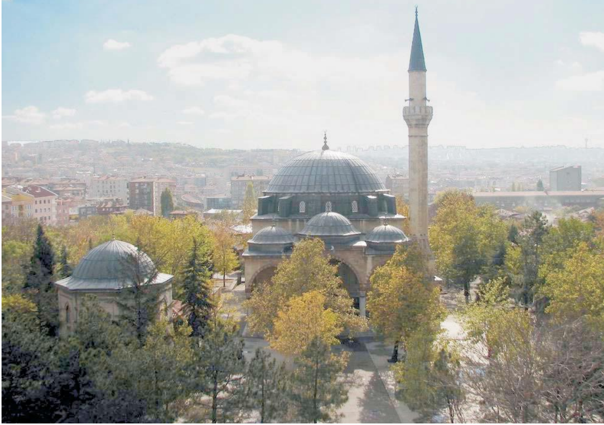
Şekil 1: Cenab-ı Ahmet Paşa Camii Külliyesi (Cenab-ı Ahmet Paşa Camii ve Türbesi) [12]

külliyyede ise Aslanhane Zaviyesi ve Aslanhane (Ahi Şerafeddin) Türbesi yer almaktadır. İncelenen yapıların 16 adedi bir avlu ya da bahçe içerisinde yer almaktadır. 7adet yapı ise yola sıfır olup herhangi bir bahçesi bulunmamaktadır.