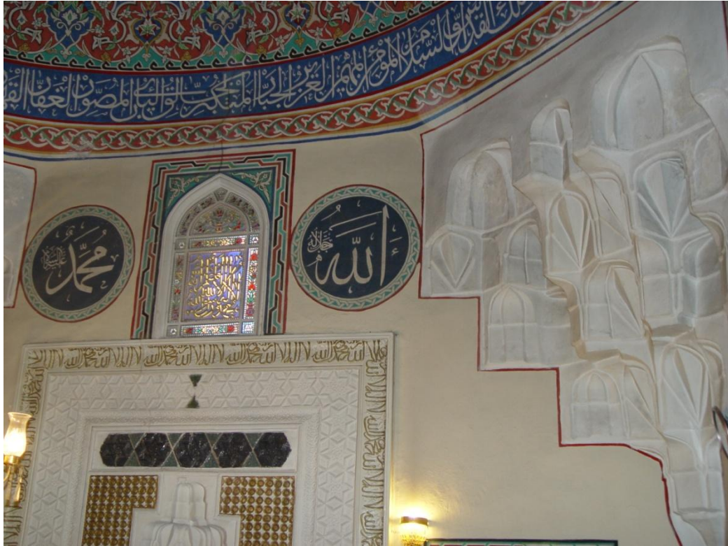
Şekil 9. Hallaç Mahmut Camii mukarnaslı tromp [12]

Kubbelerde geçiş elemanı olarak Türk üçgeni ve tromp kullanılmıştır. Saraç Sinan Mescidi'nde geçiş elemanı olarak Türk üçgeni, Hallaç Mahmut Camii (Şekil 9) ve Cenab-ı Ahmet Paşa Camii'nde (Şekil 10) ise tromp kullanılmıştır.