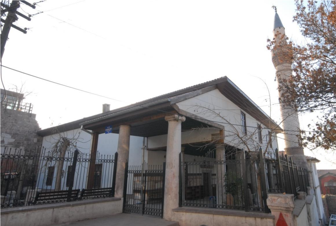
Şekil8. Sultan Alaaddin Camii son cemaat devşirme mermer sütunlar [12]