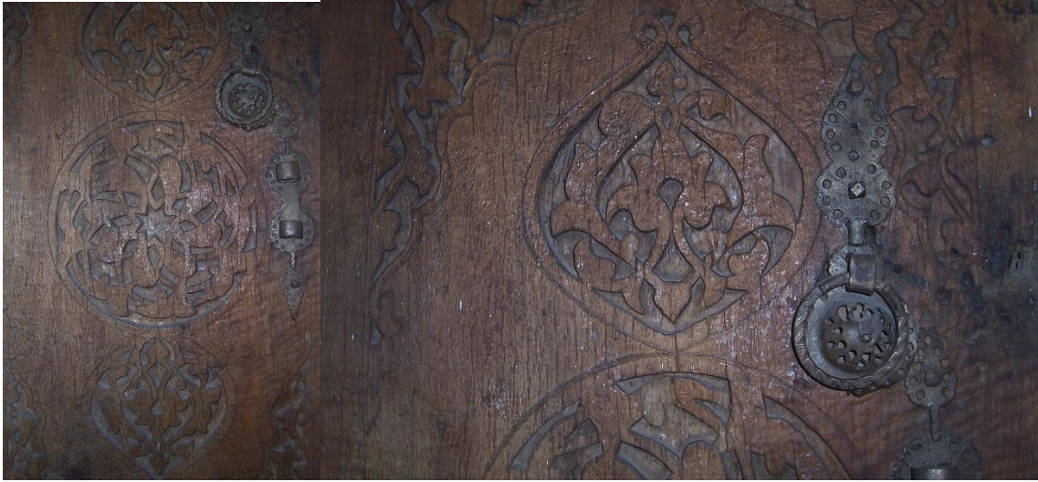
Şekil 5. Sultan Alaaddin Camii özgün ahşap kapı kanadı [9]